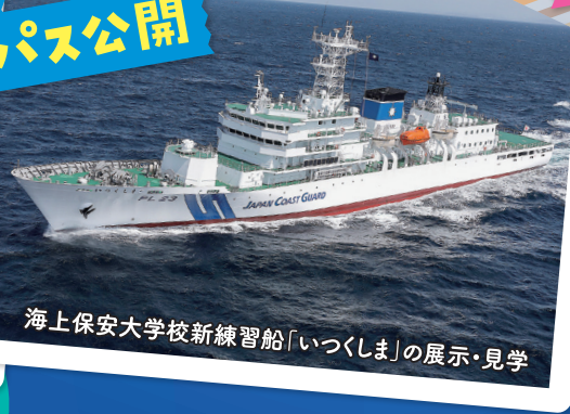
海上保安大学校新練習船「いづくしま」の展示・見学